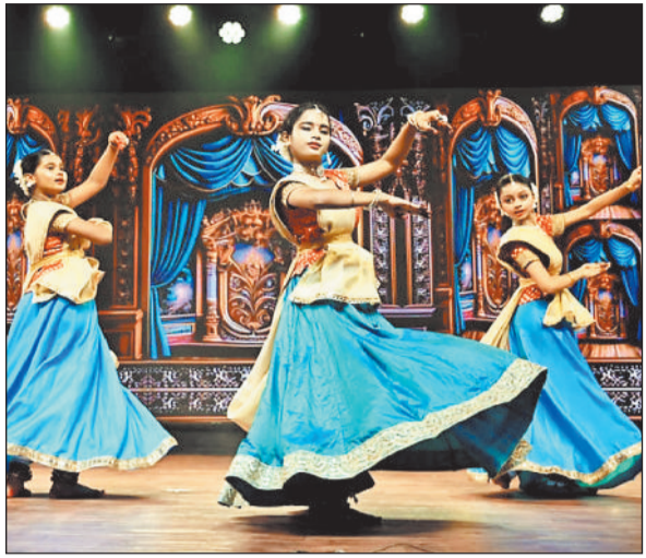
हरिभूमि न्यूज ▶▶ रायगढ़

अंतरराष्ट्रीय ख्याति प्राप्त चक्रधर समारोह 2025 के पांचवें दिन संगीत, नृत्य और लोक प्रस्तुतियों की मनमोहक छटा ने सांस्कृतिक मंच को जीवंत कर दिया। छत्तीसगढ़ शासन संस्कृति विभाग, पर्यटन मंडल एवं जन सहयोग से जिला प्रशासन द्वारा आयोजित इस ऐतिहासिक समारोह में शास्त्रीय संगीत, कथक, भरतनाट्यम, क्लासिकल डांस और मधुर गायन की अद्भुत संगम से दर्शक देर रात तक मंत्रमुग्ध रहे।