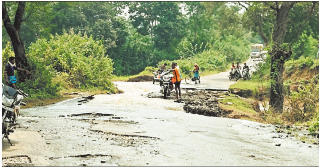
जान जोखिम में डालकर सड़क पार करते राहगीर।

हाल फिलहाल में चार पहिया वाहन वहां से किसी भी हालत में पार नहीं हो सकता। लोगों ने बताया कि बीते 15 से 20 दिनों से तेज हालत निर्मित है। जिसके चलते यहां से आने जाने में भारी परेशानियों का सामना करना पड़ रहा है चार पहिया वाहन तो पार हो ही नहीं सकते पैदल चलने वाले और मोटरसाइकिल वाले लोग थोड़ा रिक्स लेकर इधर से उधर जा पा रहे हैं। पथलगांव सिंचाई विभाग के अधिकारी बह रहे पानी को सड़क से कुछ दूर रास्ता बनाते तो कुछ बात बन सकती थी पर पथलगांव सिंचाई विभाग के अधिकारी कर्मचारियों के भ्रुस्ती का ही नतीजा है कि हाल के 3