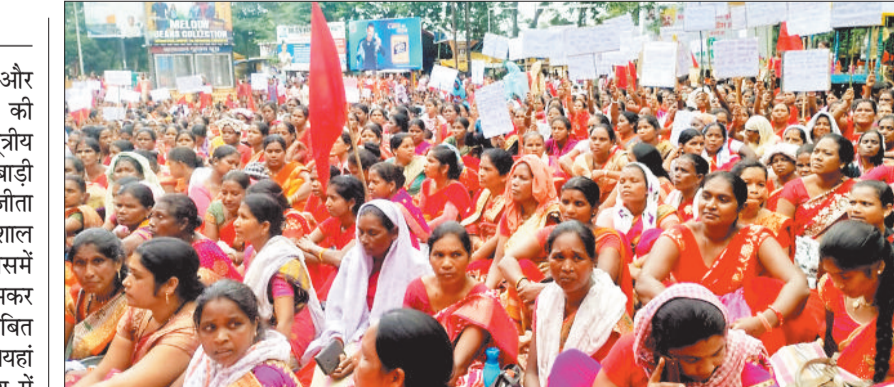
धरना प्रदर्शन करती आंगनबाड़ी कार्यकर्ता व सहायिकाएं।

जौने लायक वेतन की मांग और पदाधिकारियों पर हो रही बर्खास्तगी की कार्यवाही को वापस लेने सहित 8 सूत्रीय अन्य प्रमुख मांगों को लेकर आंगनबाड़ी कार्यकर्ताओं और सहायिकाओं ने रणजीता स्टेडियम चौक में हड़ताल के दौरान विशाल आमसभा का आयोजन किया जिसमें कार्यकर्ताओं और सहायिकाओं ने जमकर हल्ला बोल करते हुए सरकार से लंबित मांगों को पूरा करने का आग्रह किया। यहां अनेक हड़ताल की गुंज समूचे प्रदेश में सुनाई दी, अभी तक के इतिहास में पहला ऐसा हड़ताल रहा है जिसमें सरकार और शासन प्रशासन के खिलाफ कोई भी न तो नारेबाजी किया गया और न ही खिलाफ में कुछ भाषण दिया गया।